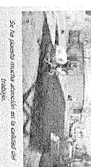
Se ha puesto mucho énfasis en la calidad del bacheo.

Por su parte, el Alcalde Enrique Peña Nieto Villareal, agradeció a los trabajadores que se esfuerzan por mejorar la infraestructura vial de la ciudad, con el propósito de garantizar la seguridad y el confort de los usuarios de la vía pública.