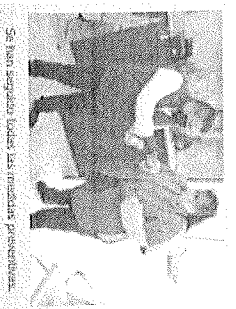
Se dan seguimiento todas las medidas preventivas.